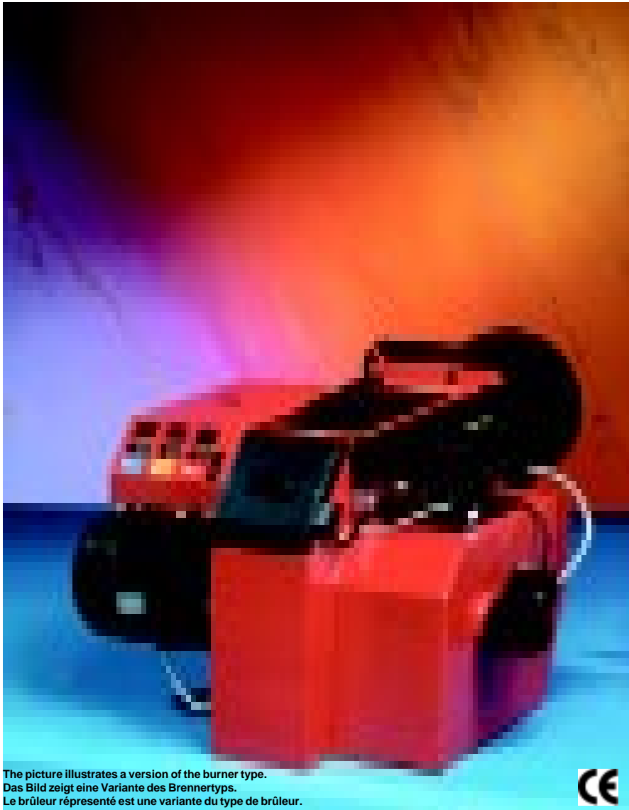
The picture illustrates a version of the burner type. Das Bild zeigt eine Variante des Brennertyps. Le brûleur représenté est une variante du type de brûleur.